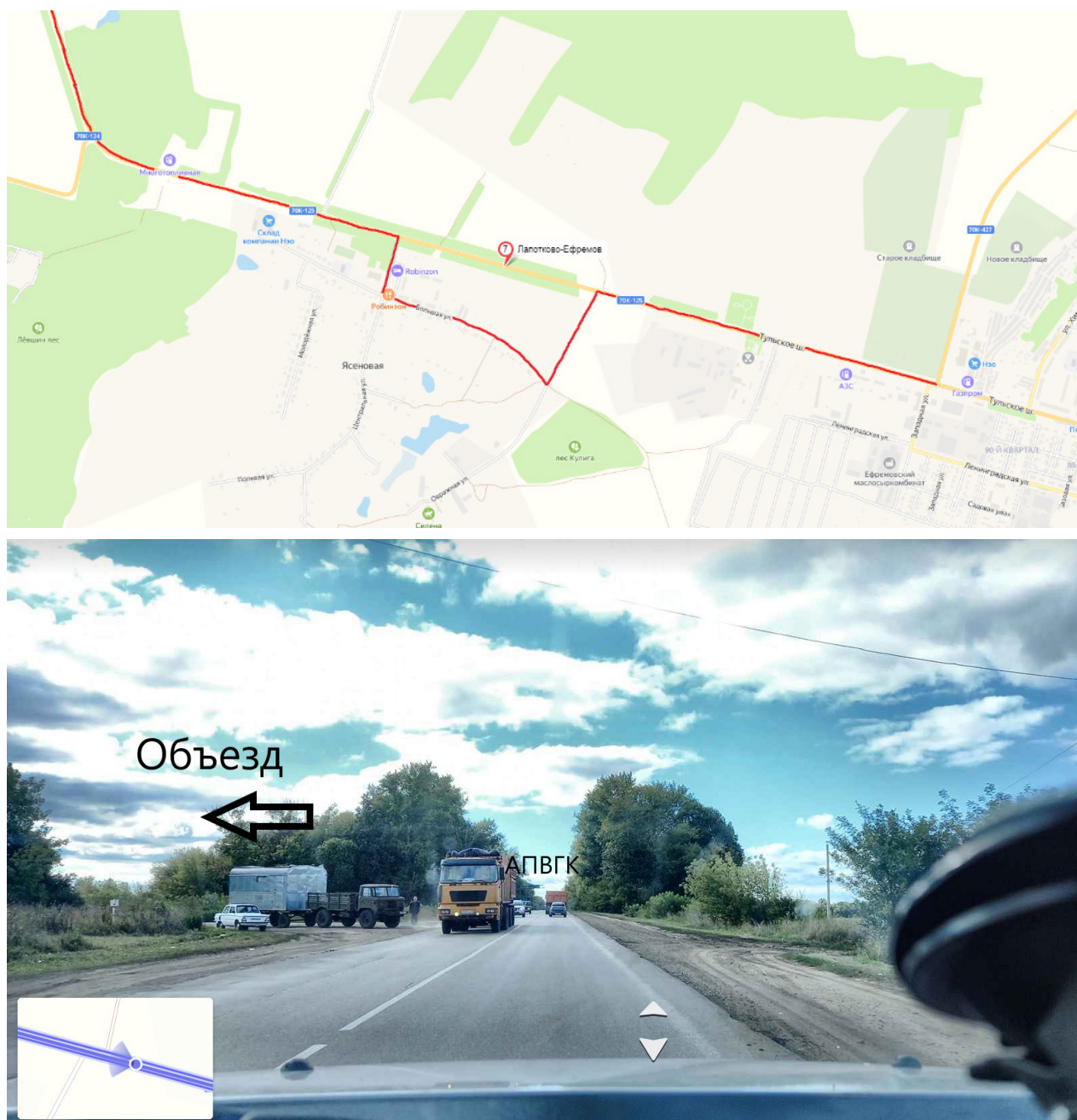
Рисунок 2. Объезд АПВГК, размещенного на км 88+490 автомобильной дороги Лапотково-Ефремов

Например, в Тульской области существует возможность объезда АПВГК, размещенного на км 88+490 автомобильной дороги Лапотково-Ефремов (рисунок 2).